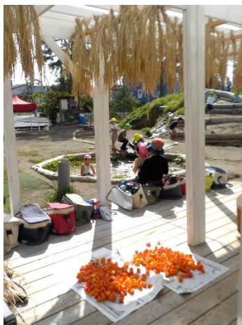
美しい稲とほうずき

今年は、リンゴ狩りやカボチャ収穫、岩農高での稲刈りなど、本当に恵まれました。食育の大切さのためにご協力いただいた皆さんに心から感謝申し上げます。